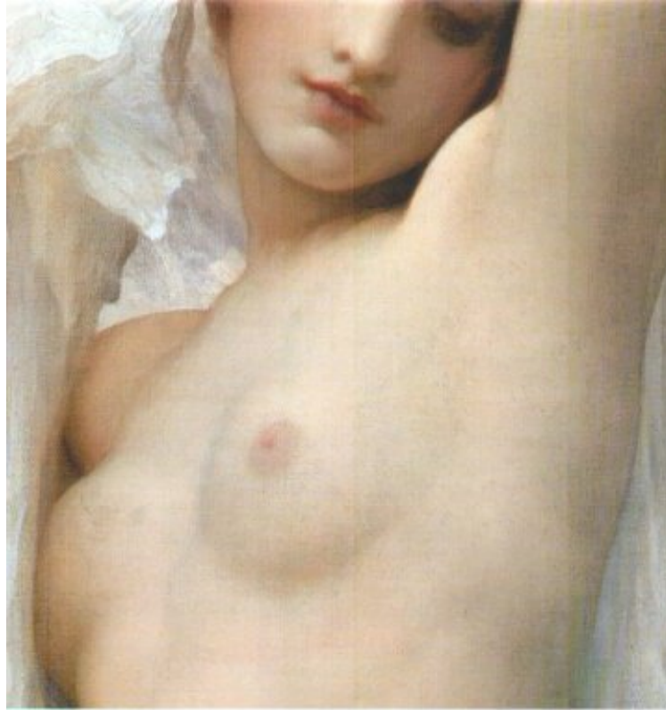
Prüderie und Leidenschaft

*Download PDF | ePub | DOC | audiobook | ebooks